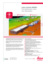
Leica Cyclone MODEL