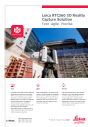
Leica RTC360 La solución para la captura de realidad 3D

Las ilustraciones, descripciones y datos técnicos no son vinculantes y pueden ser modificados. Todos los derechos reservados. Impreso en Suiza - Copyright Leica Geosystems AG, Heerbrugg, Suiza, 2016. 832256es - 12.20