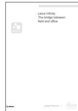
Leica In nity